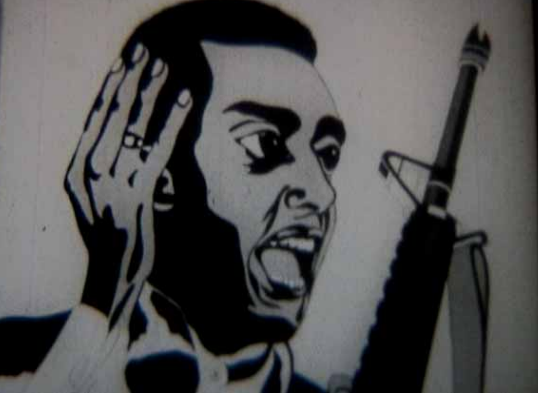
OFF THE PIG - BLACK PANTHERS