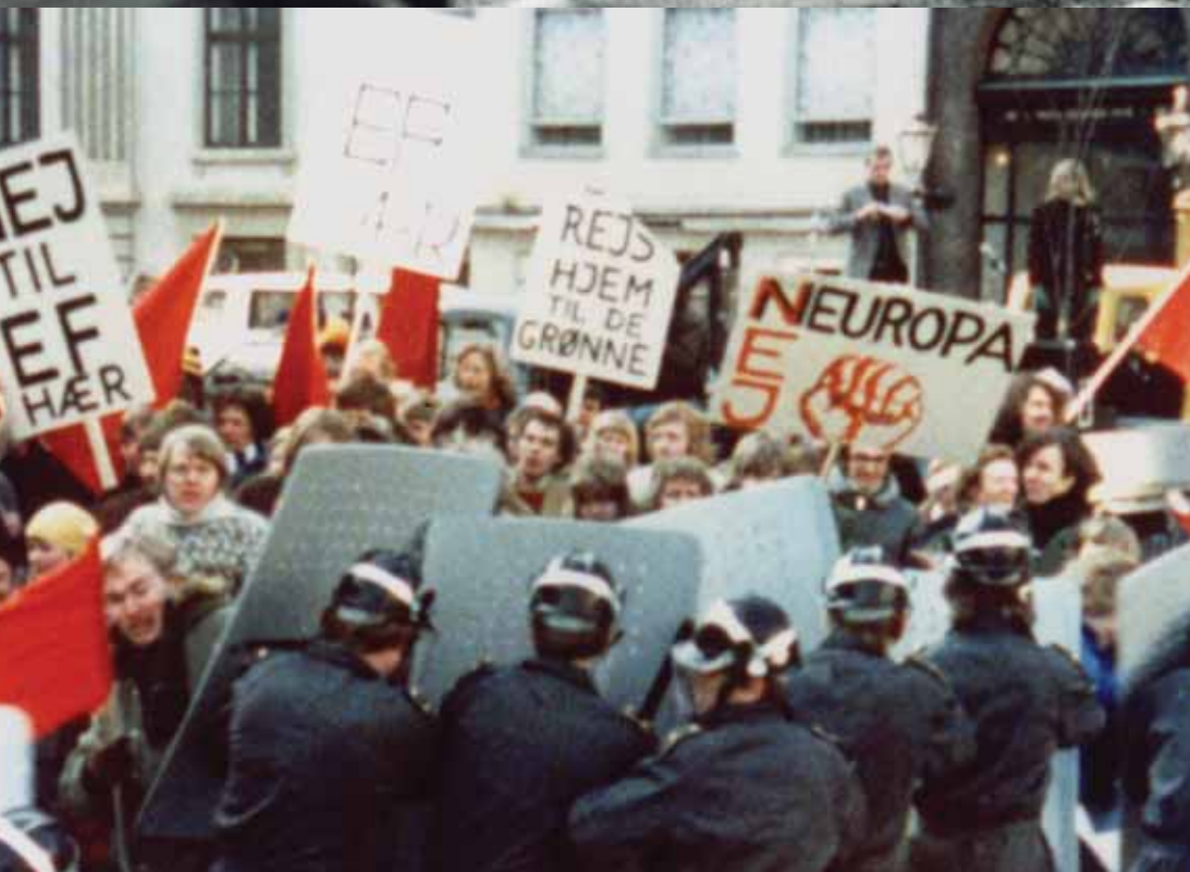
FORCE DE FRAPPE